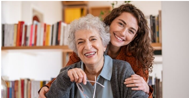
Důchodkyně se svou dcerou.

Důchodová reforma přináší řadu změn, které ovlivní budoucí důchodce a v menší míře také ty stávající. Některé změny jsou úsporné, další naopak zvyšují solidaritu a zmírňují některé podmínky pro přiznání důchodu. Podívejte se na konkrétní příklady, jak se lidí dotkne důchodová reforma.