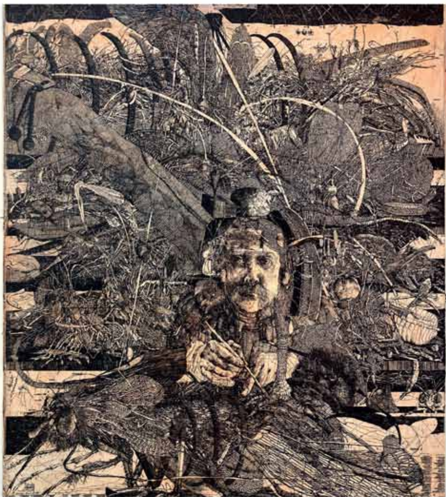
Pokúšenie Carolia Linné, farebný lept, 1987

k hlubokému zkoumání tajemství života a přírody, což se odráží v jeho dílech, která kombinují reálné prvky s fantastickými vizemi. Právě tento jedinečný přístup vytváří umělcův charakteristický rukopis, který zahrnuje realisticky ztvárněné tvary a formy, jež se mísí s magickým, až snovým světem.