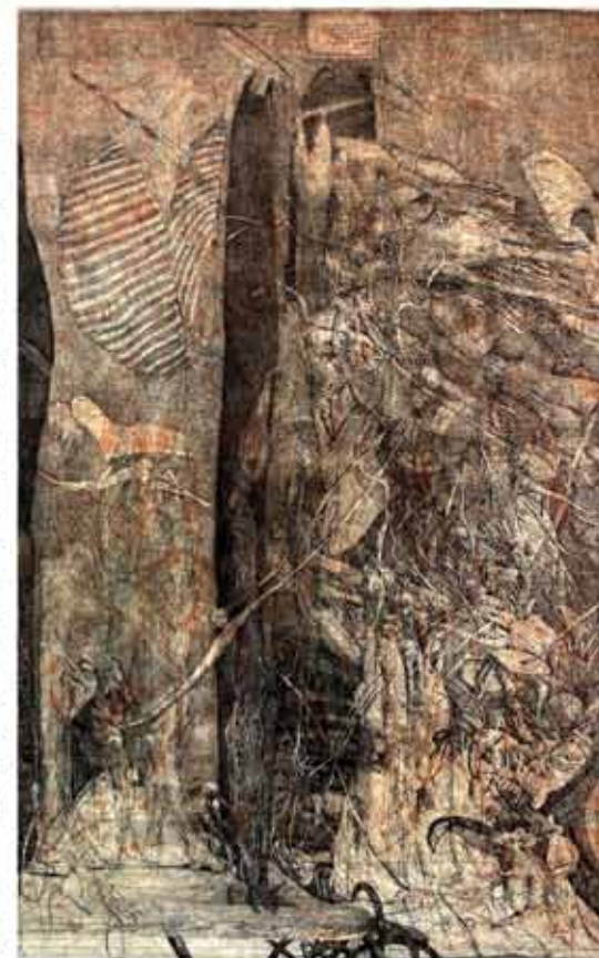
Pokušenie / z cyklu Kainova zahrada, farebný lept s okvalintou, 1987

Výstava grafik Dušana Kállaye je tedy nejen retrospektivním pohledem na dílo tohoto významného umělce, ale také pozvánkou do jeho světa plného poetiky,