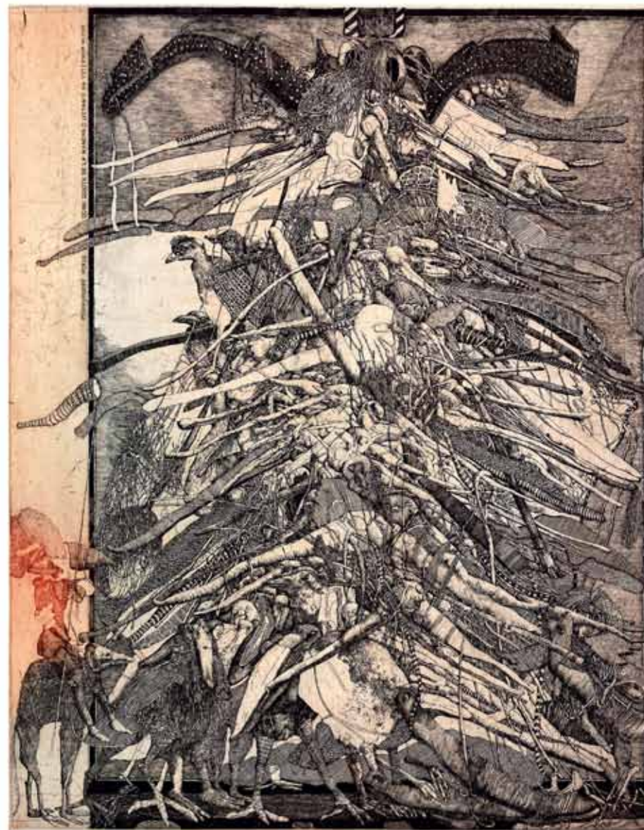
Podivuhodný pokus Dona Quieta de la Mancha o lietanie na veternom mlyne, farebný lept, 2016